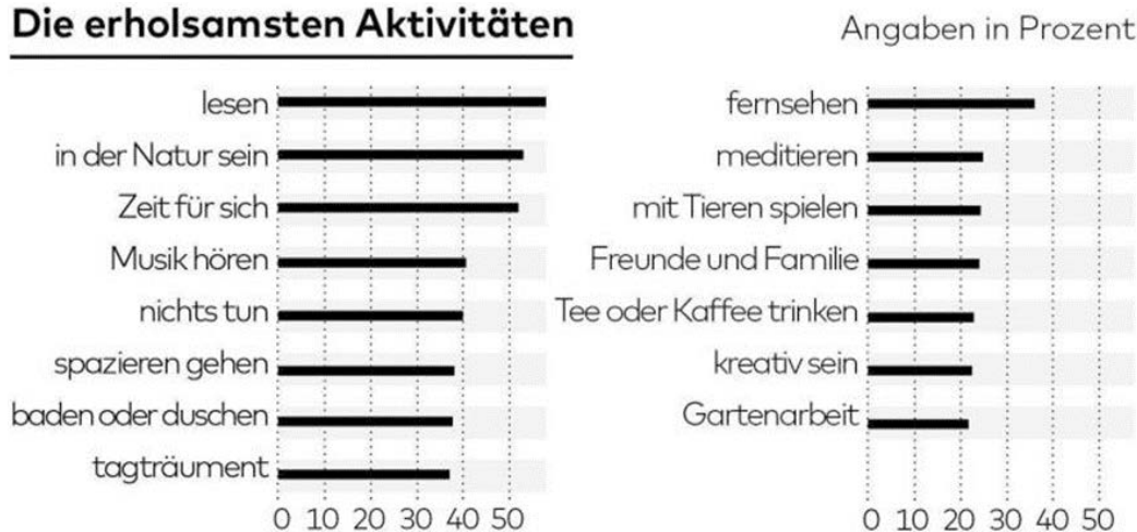
Abbildung 2: The Rest-Test: Studie zum subjektiven Umgang mit Entspannung bei 18'000 Befragten aus 134 Ländern (Hubbub, 2016)

Im Nachfolgenden finden Sie eine Reihe von Übungen, die im Alltag auch in kleinen Zeitfenstern umgesetzt werden können, und damit für Entspannung und Leistungssteigerung sorgen können.