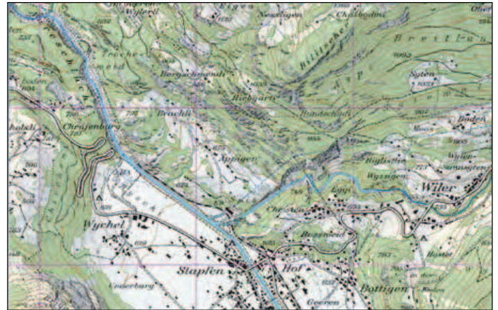
Abbildung 2: Situationsplan und Lage der Musterstrecke, Ausschnitt aus der Landeskarte 1:25'000, ohne Massstab. Fig. 2: Plan de situation et position du tronçon expérimental, extrait de la carte nationale 1:25'000. Sans échelle.

mit trocken gemauerten Bühnen unterschiedlichen Alters verbaut. Der Abstand der Bühnen beträgt rund 20 m. Sie liegen rechtwinklig zur Flussaxe. Der hier behandelte Projektperimeter der 'Musterstrecke' liegt unterstrom der Wasserrückgabe der KWO (Abb. 1 und 2). Im Rahmen des Investitionsprojekts 'Tandem' erfolgte eine Schwallanierung gemäss revidiertem Gewässerschutzgesetz (Schweizer et al. 2016). Die Aare ist hier oben noch ein überaus dynamisches Gewässer. Das 100-jährliche Hochwasser wird am rund 10 km stromabwärtsliegenden Pegel mit gut 500 m 3 /s angegeben. Zudem führt die Aare im Hochwasserfall oder bei Murgängen (beispielsweise Spreit- oder Rotlavi) sehr grosse Mengen an Geschiebe mit sich.