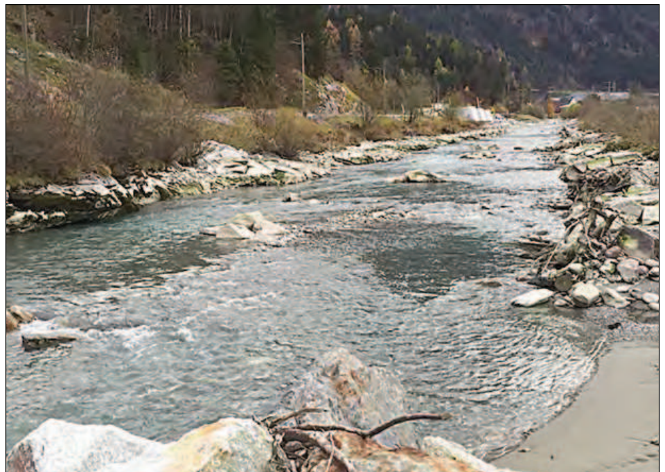
Abbildung 6: Ausschnitt der Musterstrecke bei Niedrigwasser. Fig. 6: Extrait du tronçon expérimental en période d'étiage.

Allerdings ist es schwierig abzuschätzen, welche Auswirkungen der im Sommer 2015 erfolgte Murgang sowie die Räterichsbodenseentleerung 2014/15 auf den Fischbestand hatten. Weitere Kontrollbefischungen in den Folgejahren werden diesbezüglich mehr Aufschluss geben. Grundsätzlich kann aus den Erhebungen und Bege-