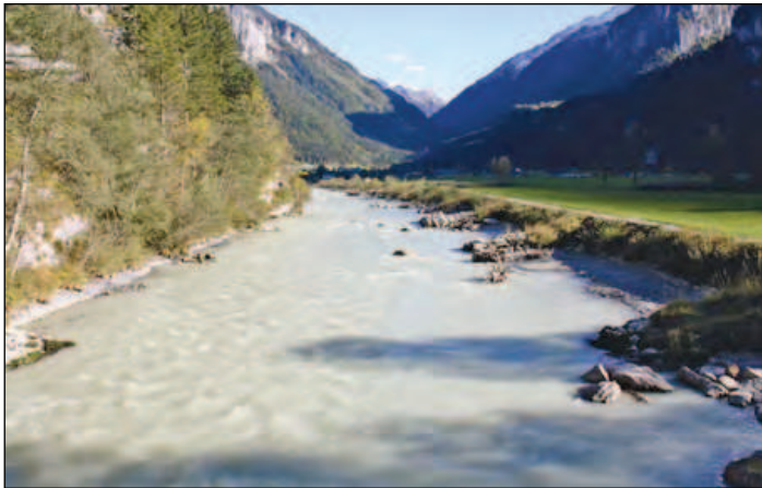
Abbildung 1: Hasliaare in Innertkirchen: Bühnenstrecke vor Umsetzung der Musterstrecke. Fig. 1: Hasliaare à Innertkirchen: tronçon à épis avant la mise en œuvre du tronçon modèle.