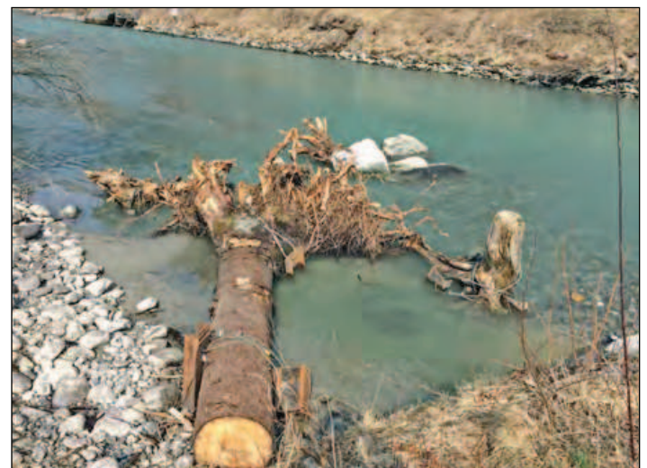
Abbildung 5: massiv mit Stahlseilen und gerammten Stahlprofilen gesicherter Stamm, Foto: K. Inäbnit, KWO. Fig. 5: Tronc consolidé avec des câbles d'acier massifs et des profils en acier. Photo: K. Inäbnit, KWO.