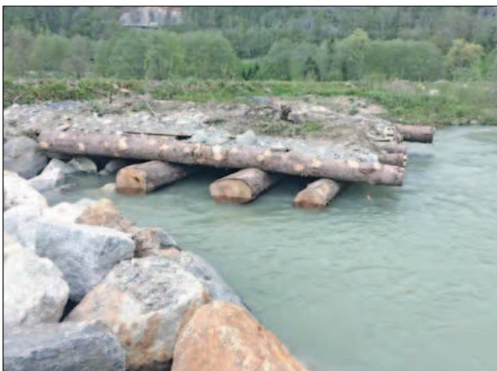
Abbildung 4 Erstmals nach dem Bau teilweise gefluteter Holzkasten, Foto: K. Inäbnit, KWO. Fig. 4: Caisse en bois partiellement inondée pour la première fois. Photo: K. Inäbnit, KWO.

rung. Der allergrösste Teil solcher Massnahmen wird aber an wesentlich kleineren und flacheren Gerinnen realisiert. Die Vervielfachung der einwirkenden Kräfte durch eine steilere Sohle oder Geschiebetrieb wird durch den Nicht-Ingenieur nur zu oft unterschätzt. An der Musterstrecke wurde diesem Umstand damit begegnet, dass versucht wurde, klassische Elemente der Gerinnestrukturierung mit massiveren Mitteln, guten Fundationen und oft auch Rückverankerungen zu realisieren. Die einfachen Wurzelstöcke im Uferbereich wurden mit Drahtseilen zurück gebunden, welche ihrerseits an gerammten Stahlprofilen befestigt wurden.