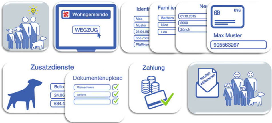
■ Abb. 5.1 eUmzugZH aus der Perspektive des Nutzers

ist dies gelungen. Nach nur zwei Monaten und noch vor Abschluss der Einführungsphase nutzt die Bevölkerung den Dienst bereits rege und mit positiver Resonanz. Der flächendeckenden Ausdehnung im Kanton Zürich steht nichts mehr im Wege und mit dem geschaffenen Referenzmodell wird die Umsetzung in weiteren Kantonen beschleunigt.