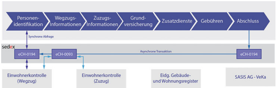
■ Abb. 5.2 eUmzugZH – Prozess und Lösungselemente

stellt sedex die asynchrone und synchrone Kommunikation sicher. Der Datenaustausch wird dabei durch verschiedene CH-Standards für das elektronische Meldewesen geregelt. eCH 0194 ist ein eigens für den elektronischen Umzug geschaffener Standard, der die Meldungen zwischen Umzugsplattform und EK-Systemen der Gemeinden definiert (eCH 2015b). Er ermöglicht die synchrone Identifikation einer umziehenden Person zu Beginn des Prozesses mittels Webservices und regelt in der Folge auch alle asynchronen Datenflüsse zwischen der kantonalen Plattform und den EK-Systemen. Ist ein EK-System nicht an sedex angeschlossen, kann der Nutzer die Daten manuell erfassen. Für den Datenaustausch zwischen den EK-Systemen kommt der bereits bestehende Standard eCH-0093 zum Einsatz (eCH 2015a). Über Webservices angebunden sind ausserdem das eidgenössische GWR (Gebäude- und Wohnregister), mit dem die neue Wohnadresse geprüft wird und das VeKa-Center, das die Online-Prüfung der Krankenversicherungsnummer prüft.