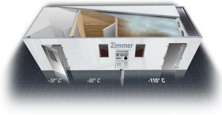
Abbildung 1: Kältekammer mit 3 Räumen (icelab MEDICAL)

Die Anwendung der Kältekammer folgt meist einem standardisierten Ablauf. Der Patient betritt die Kältekammer in Badebekleidung, die Füße, Hände, Ohren und der Mund werden geschützt. Je nach Modell der Kältekammer gibt es ein bis drei Räume. Beim Modell mit drei Räumen (Abbildung 1) findet sich zusätzlich zur Hauptkammer eine erste Kammer mit einer Temperatur von -10^{\circ}\text{C} zur langsamen Temperaturangewöhnung. Der Patient betritt für 20 bis 30 Se-