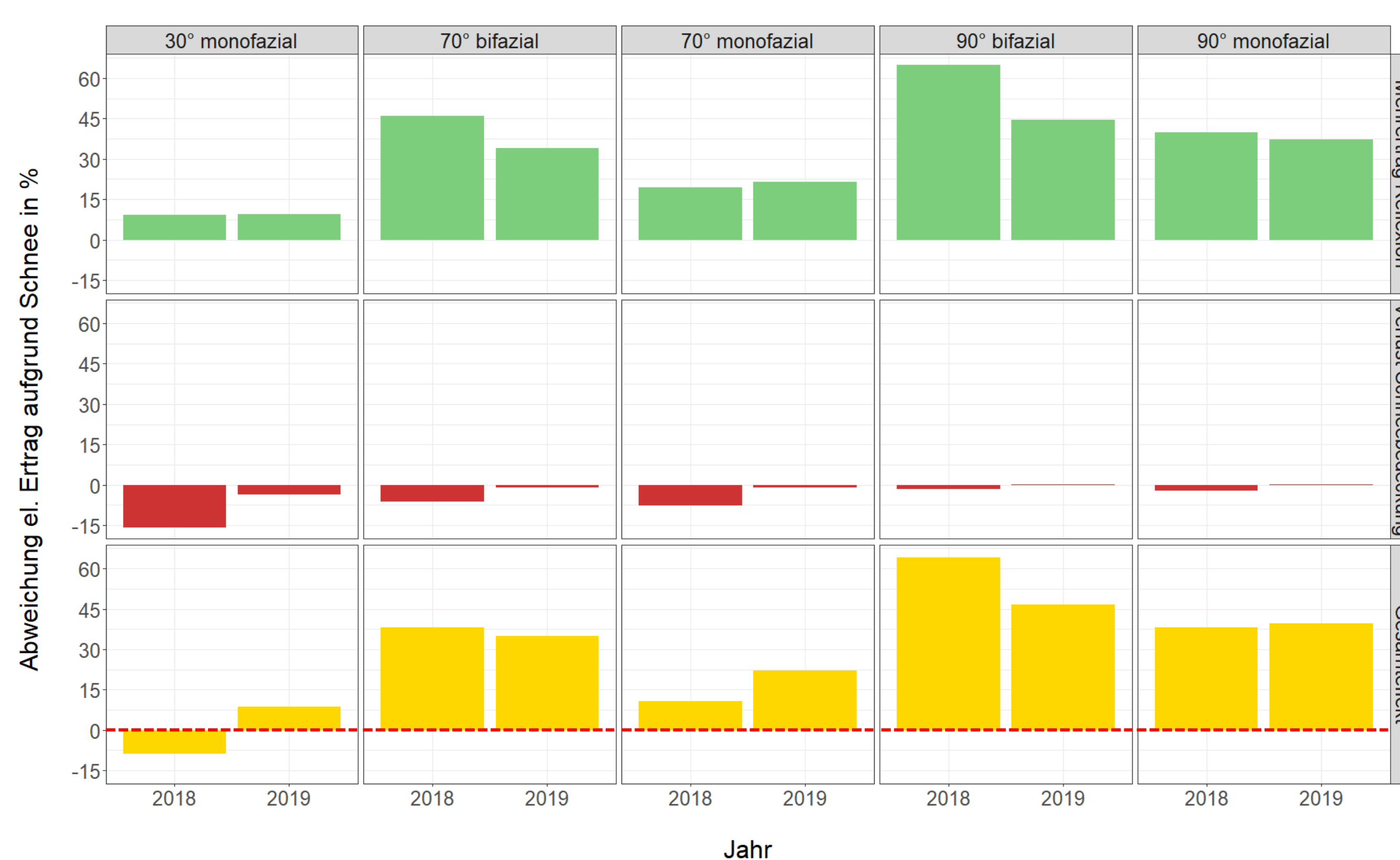
Abb. 3: Einfluss von Schnee auf den el. Ertrag aufgrund höherer Einstrahlung durch Reflexion (oben), Schneebedeckung von Modulen (Mitte) und als Gesamteffekt beider Einflüsse (unten). Abweichungen schneebedeckt (05.03. bis 04.05) gegenüber schneefrei (08.09. bis 08.10). Mehrertrag normiert pro kWh horizontaler Globalstrahlung und Modultemperatur = 25 °C.

Abb. 3 zeigt, dass die Mehrerträge durch Reflexion bei steigendem Modulwinkel zunehmen. Diese kommen durch Vorwärts- und Mehrfachstreuung an der Schneeoberfläche zustande und werden zusätzlich vom SLF modelliert. Im Betrachtungszeitraum betrug der Mehrertrag durch Reflexion bis zu 65 % (90° bifazial, 2018), während die Verluste durch Schneebedeckung maximal 16 % ausmachten (30° monofazial, 2018).