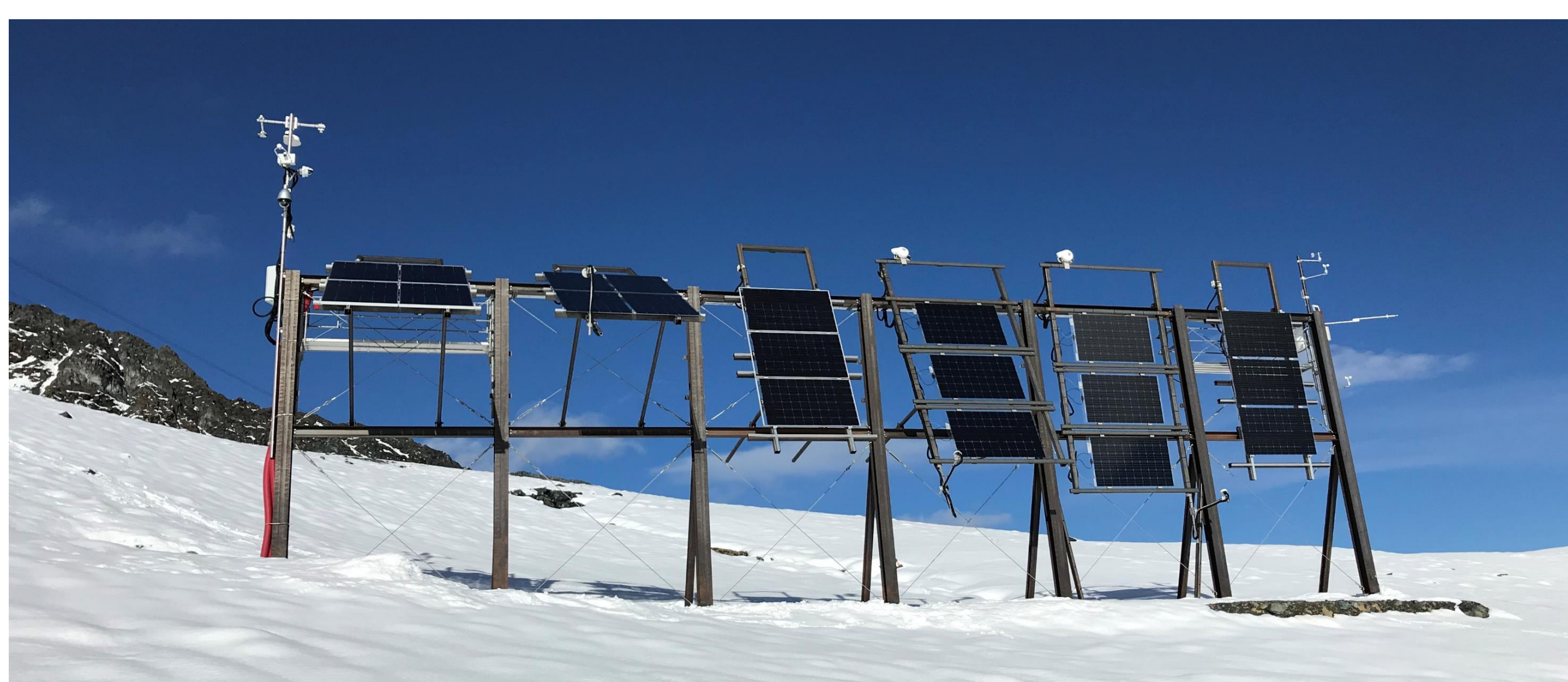
Abb. 1: Ansicht der Versuchsanlage auf 2400 m.ü.M. in Davos von vorne. Alle Module sind gegen Süden ausgerichtet.

Die Versuchsanlage in Davos besteht aus sechs Anlagensegmenten, mit frei wählbaren Neigungswinkeln (Abb. 1). Die Segmente sind v. l. n. r. jeweils 30°, 70° und 90° geneigt. Für die Neigungswinkel 70° und 90° besteht je ein Segment mit monofazialen und bifazialen Modulen.