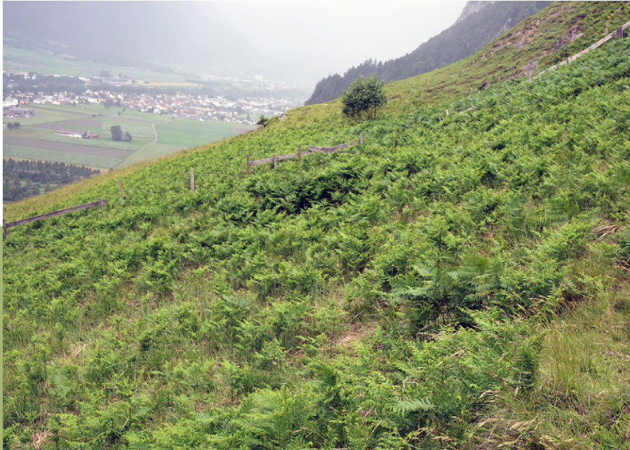
Fig. 1: Une surface disparaissant sous les fougères aigles dans la zone des butts de l'armée du Calanda, à proximité de la ville de Coire. La surface représentée n'est pas une surface d'essai.

sieurs populations denses de fougères aigles (fig. 1). Depuis plusieurs dizaines d'années des moutons sont mis en pacage dans la région de manière extensive. La végétation se compose essentiellement de prairies et de pâturages maigres riches en espèces, imbriqués les uns dans les autres et formant une mosaïque ponctuée de prés rocheux. Les populations de fougères aigles au pied du massif du Calanda sont indésirables, parce que cette espèce menace la diversité de la faune et de la flore sur un site sec d'importance nationale placé sous la protection de la Confédération (PPS; Objet n° 8516), et parce que leurs frondes, hautes et sèches, se dressent dans une région soumise au foehn et à vocation militaire (zone des butts