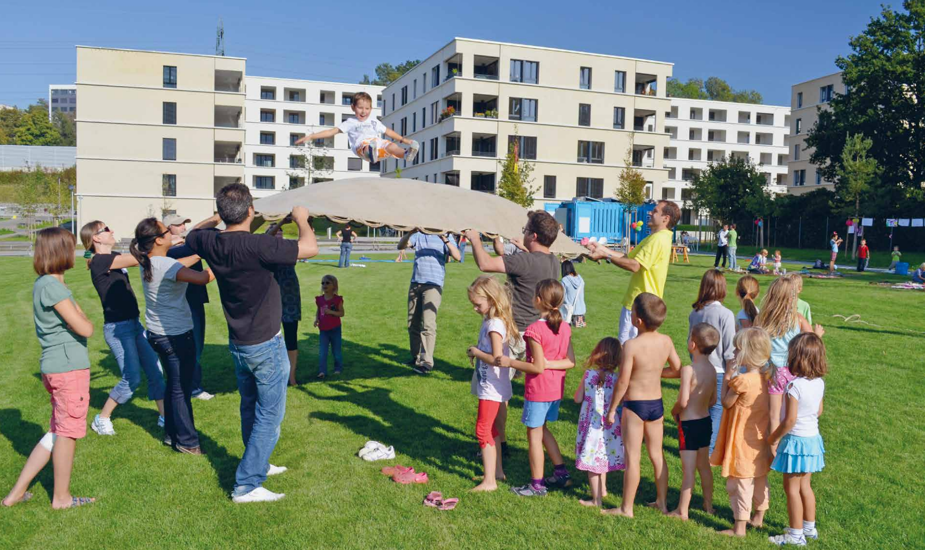
Beim Kinderspielnachmittag werden Kontakte zwischen Eltern und Kindern geknüpft.