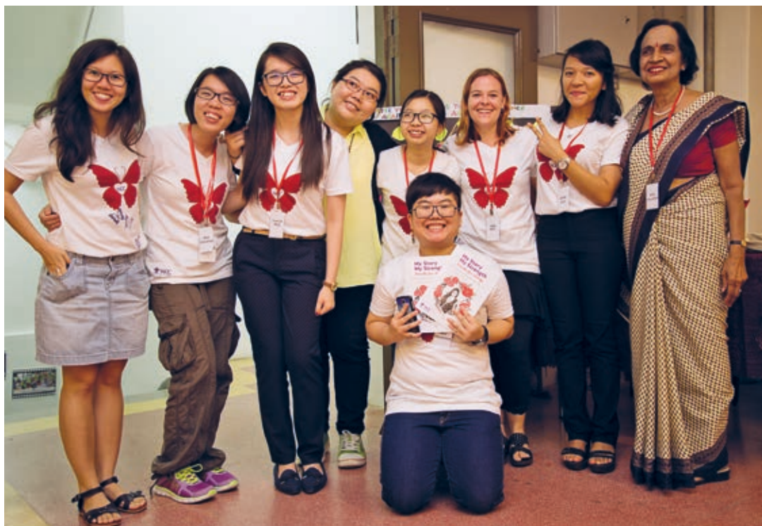
Eindrücke von der Ausstellung «My story, my strength: doodle for change» (oben) und die Praktikantinnen des WCC (unten).