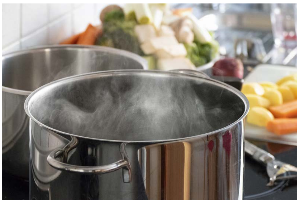
Im Café Yucca erhalten Menschen in Not professionelle Hilfe – und ein günstiges Abendessen.