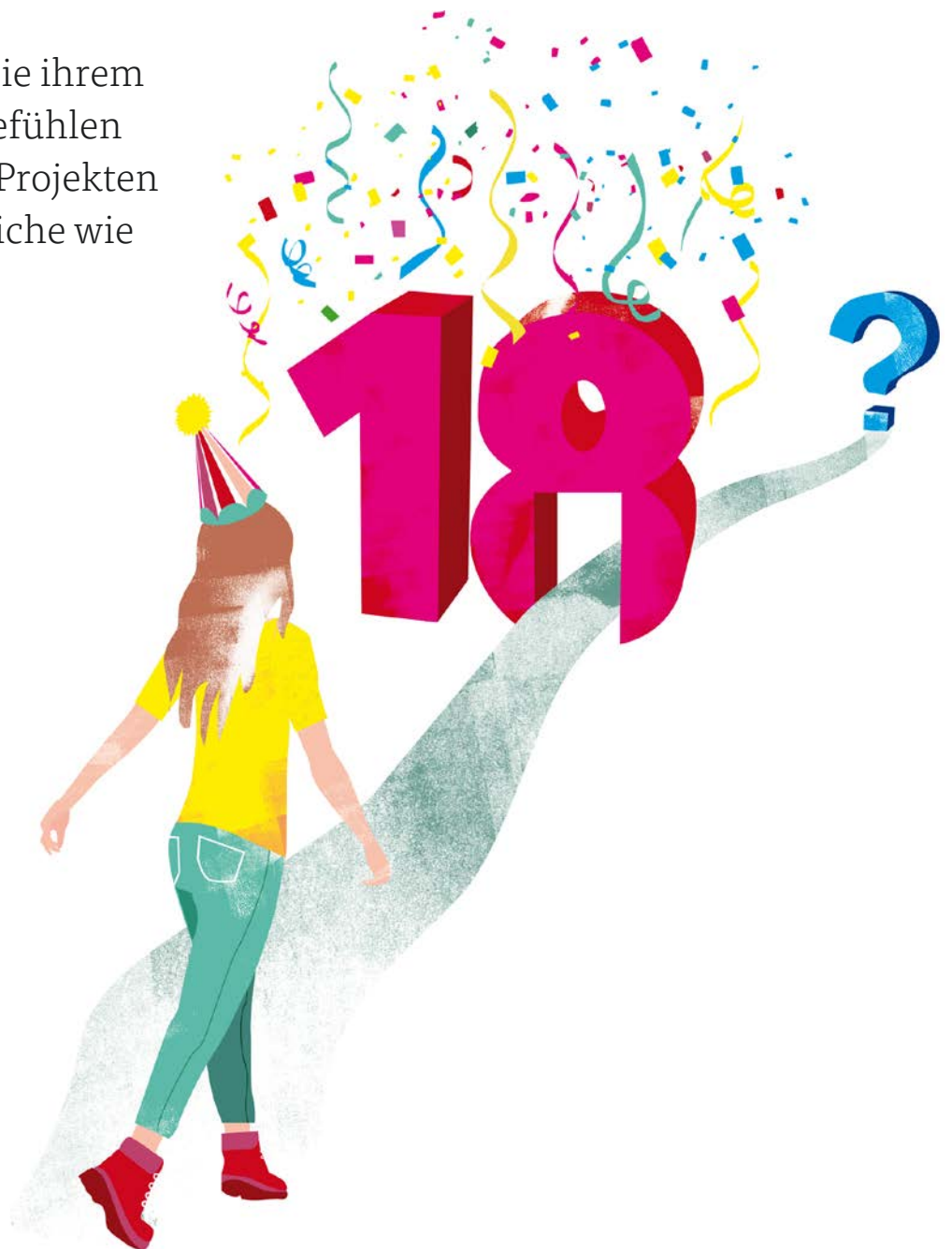
Illustration: Sarah Weishaupt

Jahren endet, erfolgt der Übergang in die Selbständigkeit bei Care Leavern früher und rascher als bei Gleichaltrigen, die bei ihren leiblichen Eltern leben. Ebenso erhalten Pflege- und Heimkinder weniger materielle, soziale und emotionale Unterstützung von ihren Familien als Gleichaltrige. Verschiedene Studien aus dem Ausland zeigen, dass die Entwicklung von Care Leavern gefährdet sein kann: Sie haben zum Beispiel ein höheres Risiko, im Erwachsenenalter arbeitslos zu werden oder Sozialhilfe zu beziehen. Für die Schweiz gibt es bislang kaum Untersuchungen zur Situation von Care Leavern.