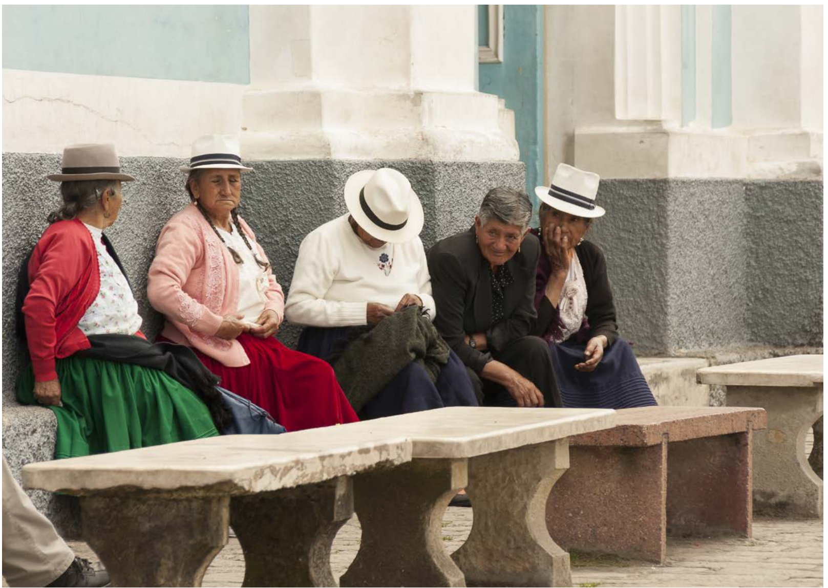
Alter in Ecuador: Familienrückhalt und finanzielle Mittel sind entscheidend.

aber zu teuer sind. Ausserdem spielen die religiöse Einstellung der Bevölkerung und die ausgeprägte Familienzusammengehörigkeit eine nicht zu unterschätzende Rolle.