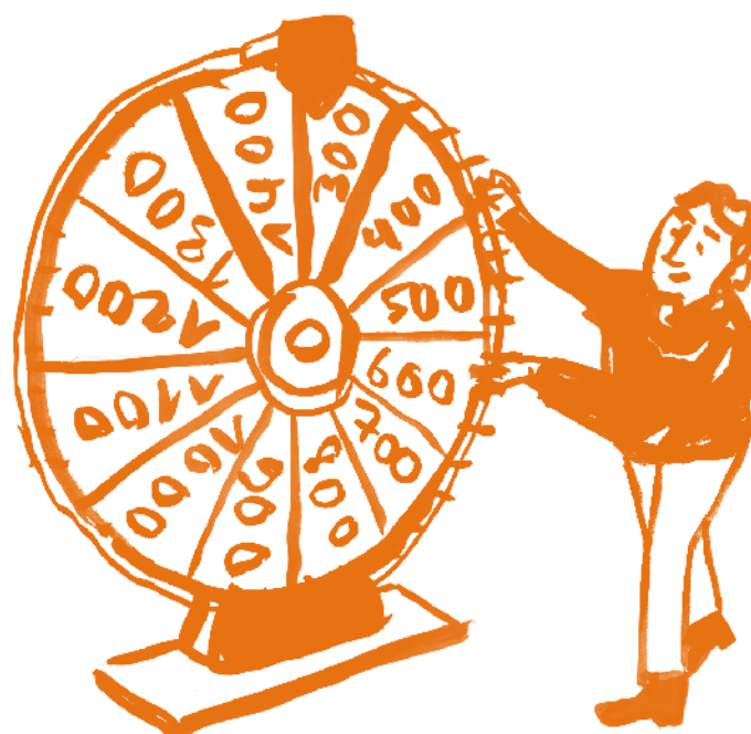
Wenn Unterstützungsleistungen zur Glückssache werden

Moritz Wyder fügt hinzu, dass das Finanzierungssystem problematisch sei und überdacht gehöre: «Eine engagierte Gemeinde muss mehr bezahlen», dies sei nicht zwingend. Welchen Einfluss die Integrationsagenda 2019 auf die Situation haben wird, bleibt abzuwarten. Gewiss ist, dass der Verein map-F sich auch künftig stark machen wird für die Verbesserung der Lebensbedingungen von vorläufig aufgenommenen Menschen.