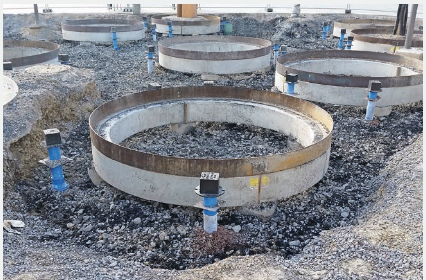
Fig. 5 Eingebautes Pflanzsubstrat mit vor Ort eingearbeiteter roher Pflanzenkohle, Baumbelüftungsrohren und Baumbewässerungswinkeln.

Pflanzenkohle, roh oder konditioniert, wird in Einzelschichten (Sandwich), eingemischt in Substraten (5–30 Vol.-%), oder eingeschlämmt in grobes Material eingebaut (Fig. 3, 5). Welche Einbauart sich längerfristig mit einer höheren Vitalität verbindet, ist nicht eindeutig. Sehr viel wahrscheinlicher dürften die Qualität und Konditionierung der Kohle sowie die Menge den Wachstumserfolg bestimmen.