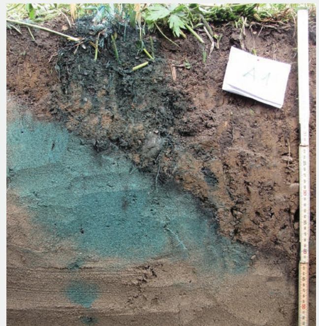
Fig. 2 Verlagerung von Pneubtrieb und Farbtracer (Brilliant Blue) in einer Strassenabwasserbehandlungsanlage (SABA), in der Bodenmaterial oberhalb einer schräg verlaufenden Sandschicht eingebaut war [30].

Bemerkenswert ist, dass der präferenzielle Stofftransport nahezu unabhängig von den Eigenschaften der Stoffe erfolgt und gelöste wie partikuläre Stoffe gleichermaßen verlagert werden können. Anhand der Färbung entlang der Schichtgrenze zwischen Bodenschicht (oben) und der Sandschicht (darunter) und in den groben Poren des Bodens ist in Figur 2 zu erkennen, dass Pneubtrieb bis zur Schichtgrenze transportiert wurde. Die in die Tiefe verlagerte Stoffmenge dürfte aber gegenüber dem