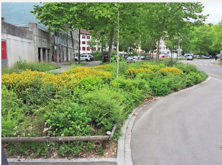
Fig. 6 Bepflanzungen im Strassenbereich mit feuchten Standortbedingungen und starker Salzlast ( A_E/A_V > 5 ).

Grosse Anschlussflächen an Pflanzgruben sind vorteilhaft, weil sie die Wasserversorgung von Bäumen deutlich verbessern und das Auswaschen