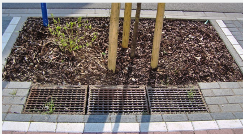
Fig. 4 Adsorbersubstrat in Rinne zur Entfernung von Spurenstoffen, Mineralölkohlenwasserstoffen, Schwermetallen und GUS aus Strassenabwasser, bevor das Wasser in eine Pflanzgrube mit Baum ( A_E/A_V \geq 5 ) geleitet wird.

Bei der Ableitung von höher belastetem Strassenabwasser bieten sich insbesondere in Grundwasserschutzzone S3 und im Gewässerschutzbereich Au kombinierte Adsorber- und Pflanzsubstrate an. Eine Pflanzgrube, in der Strassenabwasser versickert werden soll, kann als Versickerungsanlage mit vorgeschalteter Behandlung ausgeführt werden, ggf. sogar mit Vorreinigung zur Abtrennung sedimentierbarer Partikel (GUS). Anschauliche Beispiele, teils sogar mit langjähriger Betriebserfahrung, sind aus Deutschland bekannt (Fig. 4). Diese Systeme lassen sich auch in der Schweiz etablieren.