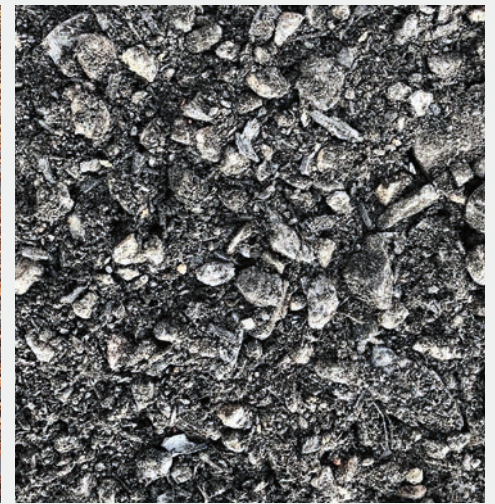
Fig. 3 Nicht überbaubare Pflanzsubstrate mit Ziegelschrot und roher Pflanzenkohle (links) und mineralisches Substrat mit kompostierter Pflanzenkohle (rechts; INKoh soil ).

Feinfraktion (<2 mm) für das pflanzenverfügbare Wasser (nFK). Zusätzlich ermöglicht die Grobfraction auch einen ausgedehnten Wurzelraum und eine tragfähige Struktur. Durch die homogene Zusammensetzung und den geringen Tonanteil dominiert das Einzelkorngefüge (Fig. 3). Zu den natürlichen mineralischen Gerüstbaustoffen und schadstofffreien mineralischen Recyclingbaustoffen (RC-Materialien) zählen beispielsweise natürlicher Boden, Landerde, Sande wie Bruchsand aus Granit, Ziegelsand aus Bruchziegel, Blähschiefer, Splitt, Schotter, Steinmehl und Kieswaschschlamm. Als Landerde gilt ein tonhaltiger Oberboden, der beispielsweise bei der Zuckerrübenwäsche anfällt. Unter Einhaltung gesetzlicher Vorgaben sind gemäss FLL auch industrielle Nebenprodukte zugelassen. Die Substrate dürfen aber keine Stoffe enthalten, die das Grundwasser belasten können [44]. Die Schadstoffgehalte in den Einzelfractionen oder der Substratmischung werden jedoch nur gelegentlich angegeben.