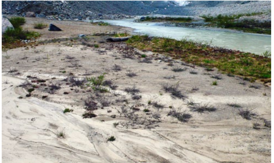
Im feuchten Schluff am Ufer haben im Jahr zuvor einige Tamarisken gekeimt (noch in grau vor dem Laubaustrieb). Die schon ergrünten Konkurrenten halten respektvolle Distanz

es gerade dort so viele hat und wie sie sich in dieser unwirtlichen Umgebung ausbreiten, ist Thema der Untersuchung der ZHAW.