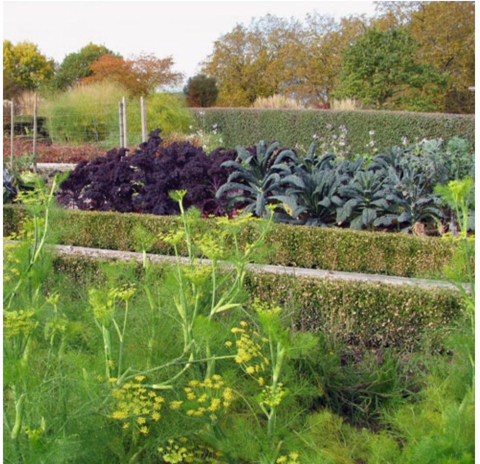
Der Sortenschaugarten Gemüse der ZHAW

Die FAO (Food and Agriculture Organization of the United Nations) hat 1996 den Weltaktionsplan zur Erhaltung und nachhaltigen Nutzung der pflanzengenetischen Ressourcen verabschiedet. Die Schweiz hat diesen in einem Nationalen Aktionsplan (NAP) konkretisiert. Ziel des NAP ist die Unterstützung nationaler und regionaler Projekte zur Förderung der Agrobiodiversität. Das Bundesamt für Landwirtschaft unterstützt diese Projekte finanziell, denn: «Die Biodiversität trägt zum Lebensunterhalt und zur Sicherung des Lebensraumes der Menschen bei. Pflanzen- und tiergenetische Ressourcen sind das wichtigste Ausgangsmaterial für die Weiterentwicklung von Kulturpflanzen sowie Haus- und Nutztierassen durch Züchter und Bauern.»