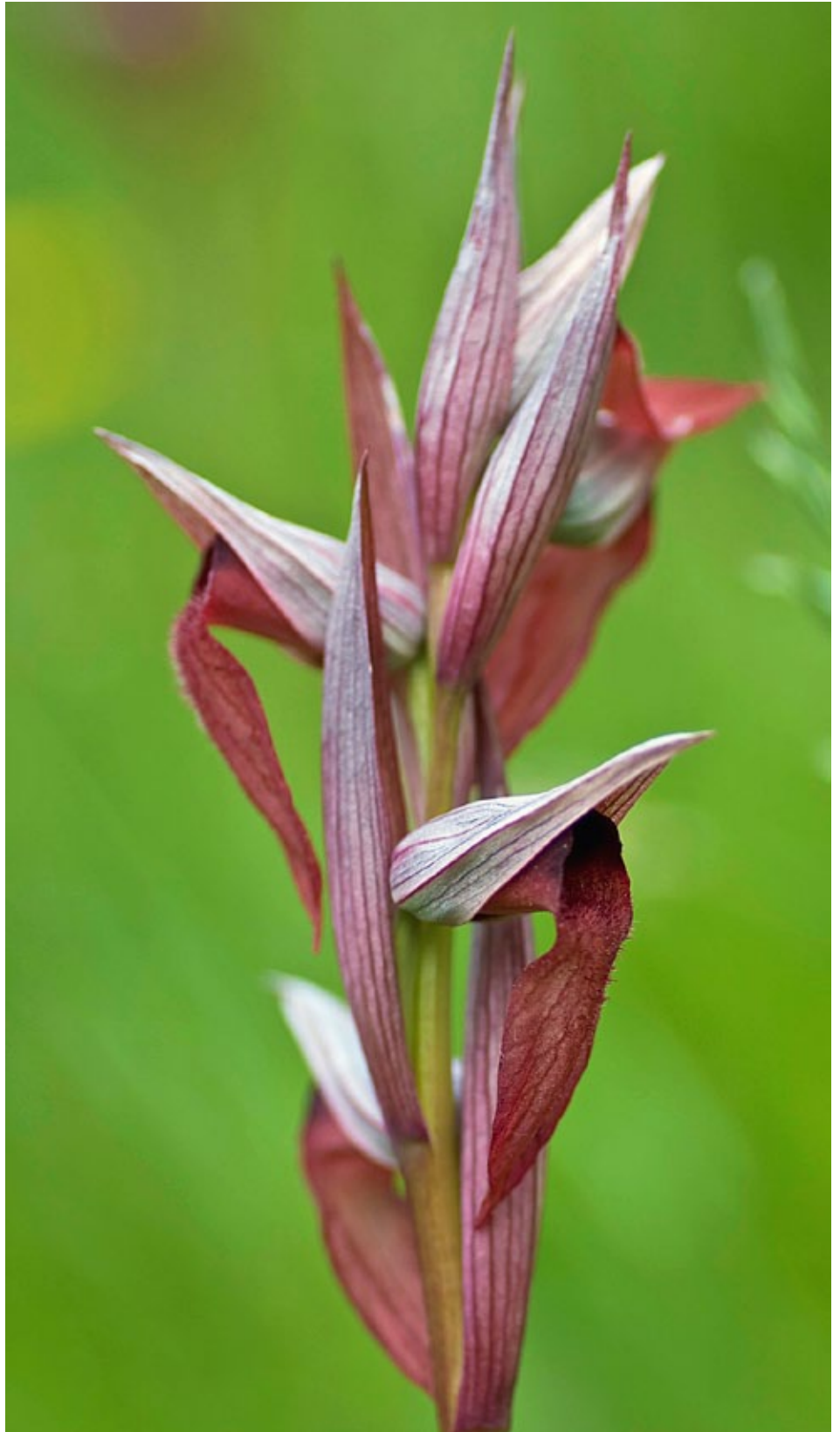
Serapias vomeracea