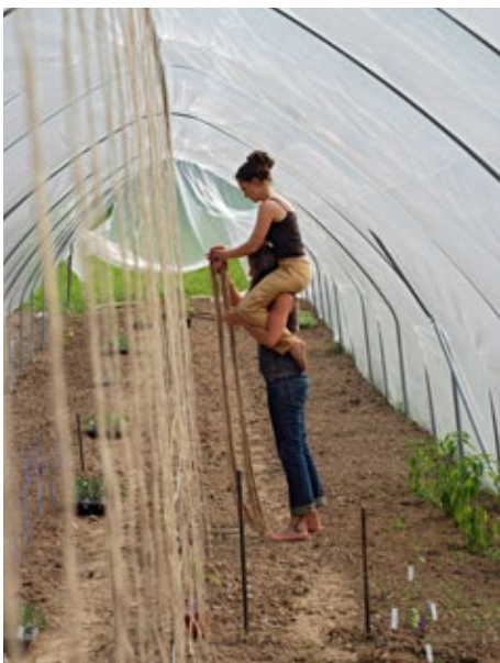
Unkonventionelle Arbeitsmethoden