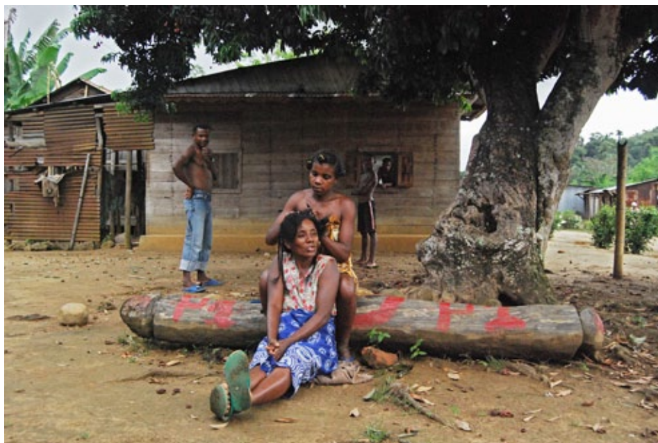
Einheimische sitzen auf dem begehrten Rosenholz

hier geöffnet. Eindruck gemacht hat mir, wie sich meine Mitstudenten und wohl auch ich im Präsentieren und Ideen verkaufen verbessert haben während des Studiums. Allerdings hätte mir ein Modul in Fundraising und Proposal schreiben echt was gebracht. Denn hier dreht sich oft alles um die Frage «Haben wir Geld dafür?»