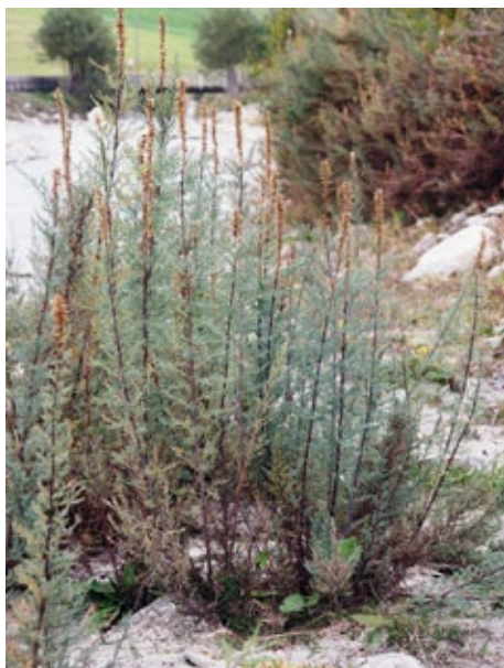
Ausgewachsenes und blühendes Exemplar einer Deutschen Tamariske am Ufer eines Wildbachs

In der Schweiz wachsen unter anderem an einigen Stellen im Engadin noch Tamarisken entlang von Bächen und Flüssen. Eine sehr grosse Anzahl findet sich im rauen, schottrigen Vorfeld des Morteratschgletschers am Berninapass. Warum