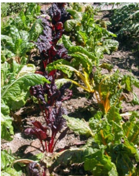
Krautstiel: Ein typisches altes Schweizer Gemüse in verschiedenen Farben

Am IUNR gibt es seit 2003 einen Gemüse-Sortenschaugarten, welcher im Rahmen eines der NAP-Projekte entstanden ist und nebst traditionellen und wertvollen Gemüsesorten auch Kräuter, Färbepflanzen, Getreide und Zierpflanzen zeigt.