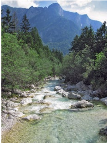
Die kristallklare und türkisblaue Soča

Wow, das Essen in Trenta war üppig: am ersten Abend gab es Fleisch, als Beilage Hühnchen