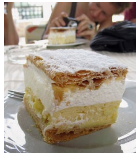
DIE Bleder Crèmeschnitte