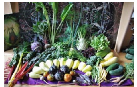
Aufstellen des Folientunnels unter fachkundiger Leitung von Anton Le Fèvre (oben); Jungpflanzen von Chili und Tomaten (unten links) und die üppige Ernte dieses Jahres (unten rechts)