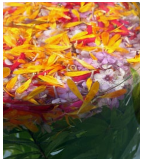
Titelbild: siehe «HANS NIEDERER – Ein Original verlässt die ZHAW auf Seite 8

Frühere Nummern können heruntergeladen werden unter: www.unr.ch/unrintern