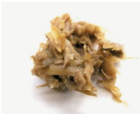
Biertreber unverkohlt (links), Biertreber nach dem HTC-Verfahren