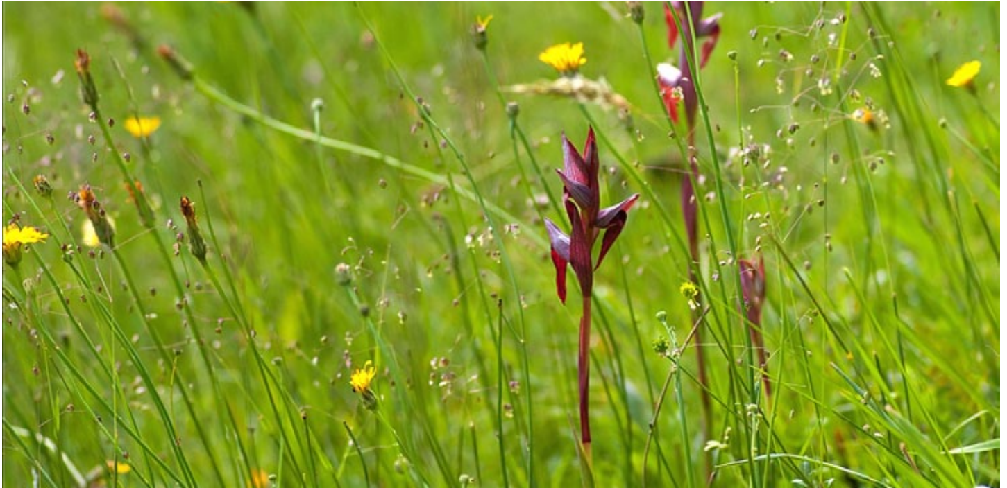
Serapias vomeracea am Wildstandort im Tessin

ursprünglich vorhandener Populationen resp. deren Lebensräume sind die wenigen überlebenden Populationen räumlich voneinander isoliert. Wenn eine Wildbiene, welche die Orchidee als Schlafplatz nutzt und auf Langstreckenflüge bis zur nächsten, weit entlegenen Population verzichtet (und sie verzichtet!), so stockt nicht nur der genetische Austausch zwischen den Individuen – es stellt sich oft eine sogenannte genetische Depression ein oder anders formuliert: es herrscht Inzucht. Wegen der genetischen Instabilität der isolierten Kleinpopulationen nimmt die Abundanz über Jahrzehnte ab und das Vorkommen erlischt schliesslich ganz. Macht nichts, könnte man meinen: ein anderer genetisch stabiler Zungenstendel produziert doch Tausende an Samen, Jahr für Jahr. Nur, die Entwicklung des Samens bis hin zum ausgewachsenen, erstmals blühenden Individuum dauert mindestens 4 bis 7 Jahre und von den Tausenden an Samen werden in der Regel ein paar wenige Exemplare das erste Blühen erleben. Denn die Serapias vomeracea ist, wie alle anderen 25000 Orchideenarten der Welt, von einem Mykorrhizapilz abhängig. Dieser geht mit dem Samen eine Symbiose ein und ernährt den Keimling und die daraus wachsende Jungpflanze