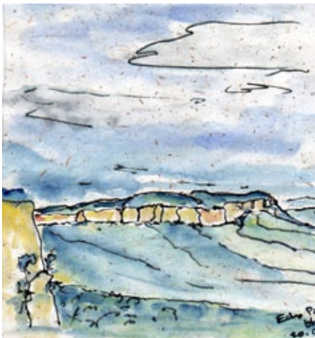
Bluemountains (Illustration: Hans-Rudolf Keller)

Den grössten Teil meiner beruflichen Karriere habe ich dem wohl energieintensivsten Bereich der Pflanzenproduktion gewidmet: der Zierpflanzenproduktion unter Glas im kontinentalen Klima der Schweiz. Dabei sind trotz allem ein paar Erfahrungen zusammen gekommen, die mich als Dozenten am IUNR qualifiziert haben. Seit bald 10 Jahren. Vom Leben schon durch einige Umbrüche an ständigen Wechsel adaptiert, sehe ich mit einiger Zuversicht der Neuorientierung BLH und des UI-Studienganges insgesamt entgegen. Da tun sich Welten auf, an die vor 20 Jahren kaum zu denken war. Und das erfordert auch geistige Neuansätze.