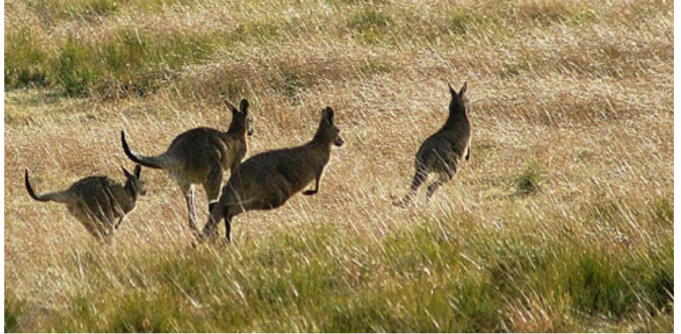
Escaping Kangurus

Australien gilt als Ursprungsland der Permakultur. David Holmgren und Bill Mollison haben diesen Begriff vor mehr als 30 Jahren in die Welt gesetzt. Permakultur gilt als geistiges Exportprodukt Australiens. Sie befasst sich mit Werten und Visionen, Design und Managementsystemen aus holistischem Verständnis. Die 12 Prinzipien der Permakultur sind in David Holmgrens Buch «Permaculture – Principles & Pathways Beyond Sustainability» anschaulich erklärt. Etwas missionarisch vielleicht und nicht exakt den Regeln akademischer Argumentation folgend. Aber doch einleuchtend und ein frischer Denkansatz dazu, wie künftige Generationen auf diesem Planeten leben und sich verhalten könnten. Zumindest ein Kontrapunkt zur konventionellen Agronomie und auch über das hinaus gehend, was biologische Landwirtschaft an sich beinhaltet. Die Inhalte tangieren alle Vertiefungsbereiche, welche im Studiengang Umweltingenieurwesen zusammen gefasst sind. Landwirtschaft, urbaner Raum, Naturmanagement, Landschaft, Bildung und Tourismus, nachwachsende Rohstoffe und erneuerbare Energien. Für einen UI-Studierenden somit durchaus lesenswert.