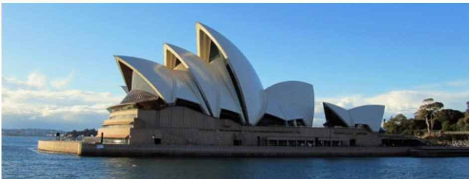
Ferry, Operahouse and Sheeps