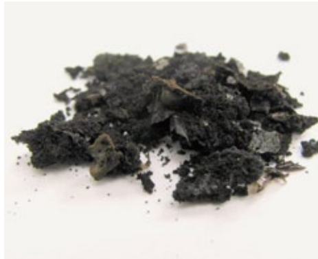
HTC-Kohle aus Molke (links) und Klärschlamm (rechts)

Mit Hilfe der hydrothermalen Karbonisierung (HTC) wird frische Biomasse innerhalb einiger Stunden in HTC-Biokohle und Wasser umgewandelt. Die umgesetzte Biomasse behält nahezu 100 Prozent des ursprünglichen Kohlenstoffs, zwei Drittel des ursprünglichen Brennwertes bleiben erhalten, der Rest fällt als Prozesswärme an. Der HTC Prozess verläuft schnell und einfach, ausserdem wird bei der HTC soviel Energie frei, dass für den ganzen Betrieb einer Anlage