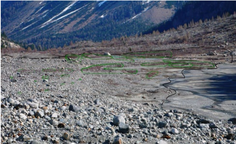
Nacktes, steiniges Land und Bachläufe: Lieblingsterritorium der Tamariske

Ganz sinnlos ist ihr Ausharren dennoch nicht. Denn aus dem grasbestandenen Waldboden, der sich um sie herum ausgebreitet hat, kann innert kurzer Zeit wieder nackter Sand werden: Steinschlag von den Seitenmoränen herunter, von Lawinen entwurzelte Bäume, von Hochwassern mitgeschwemmte Ufer. So kann sich auch in grossem Abstand von der Gletscherstirn wieder ein junger Bestand an Tamarisken einfinden. Diese ständig neu geschaffenen rohen Böden finden sich natürlicherweise an den Ufern von Alpenflüssen bis ins Flachland hinaus. Der ständig wechselnde Wasserstand und die immer wiederkehrenden Hochwasser lassen die Ufer nie zur Ruhe kommen und bieten der einzelgängerischen Tamariske immer wieder neues Territorium, in dem sie fast alleine herrschen kann.