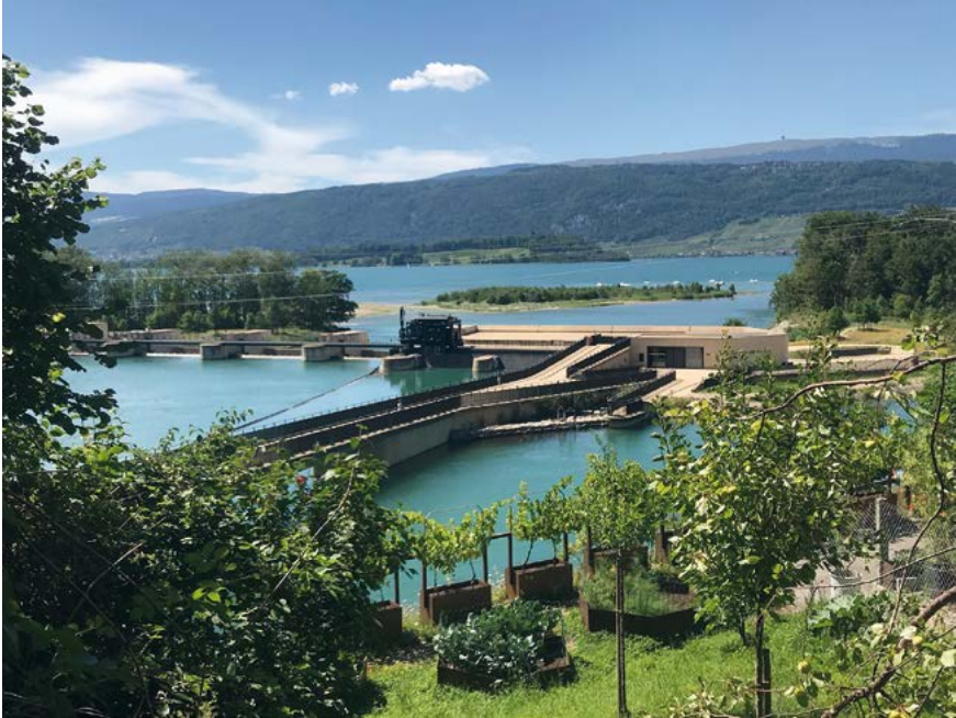
Das Laufwasserkraftwerk Hagneck

versorgungsgesetz fest, dass es nur eine nationale Netzgesellschaft gibt, die das Übertragungsnetz betreibt (Art. 18 Abs. 1 StromVG). Das Übertragungsnetz ist also auch ein rechtliches Monopol 27 . Infolge des Monopols gibt es keinen direkten Wettbewerb zwischen mehreren Betreiberinnen 28 .