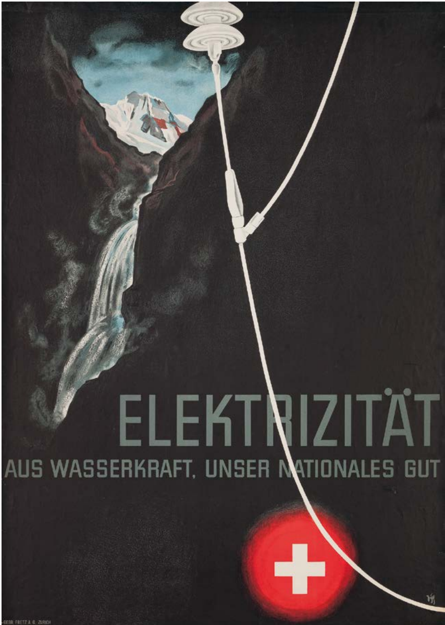
Plakat. Farblithografie von Alex Walter Diggelmann, 1936