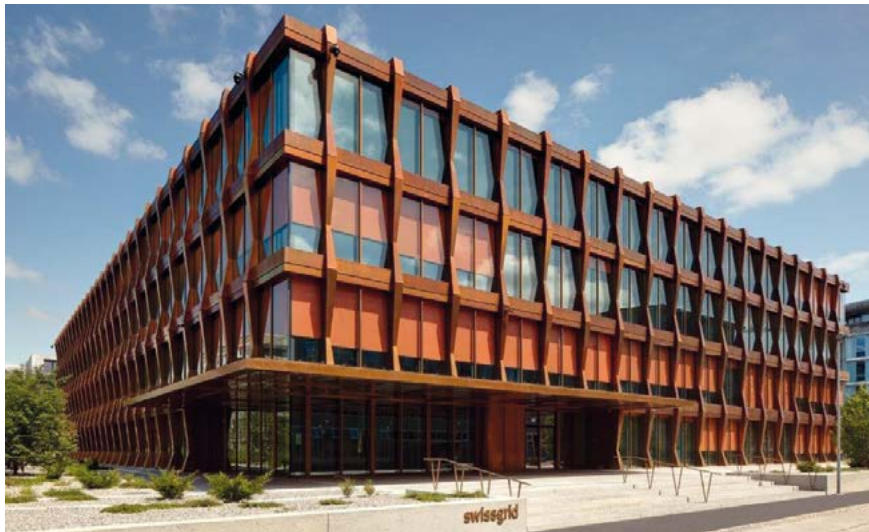
Der Hauptsitz von Swissgrid in Aarau

23. ... und 2007 rechtlich die nationale Netzgesellschaft. – Auch herauszufinden, wo eigentlich steht, dass Swissgrid die nationale Netzgesellschaft ist, kommt dem Lösen eines Rätsels gleich: Dass Swissgrid die nationale Netzgesellschaft ist, steht in keinem Gesetz, sondern wird kurioserweise einzig in Art. 2 der Statuten der Swissgrid 63 festgehalten. Die Statuten sind immerhin vom Bundesrat genehmigt worden (s. Art. 19 Abs. 1 StromVG). Gemäss Art. 2 der Statuten bezweckt Swissgrid «als nationale Netzgesellschaft den diskriminierungsfreien, zuverlässigen und leistungsfähigen Betrieb des Übertragungsnetzes als wesentliche Grundlage für die sichere Versorgung der Schweiz und der einzelnen Landesteile im Rahmen des europäischen Verbundbetriebes sowie die Erbringung damit zusammenhängender Dienstleistungen, wie insbesondere Bilanz- und Engpassmanagement, Systemdienstleistungen (s. n° 46) und Wahrnehmung nationaler und internationaler Interessen im Übertragungsnetzbereich»; sie «kann Zweigniederlassungen und Tochtergesellschaften errichten, sich an anderen Unternehmen beteiligen sowie Grundstücke erwerben, halten und