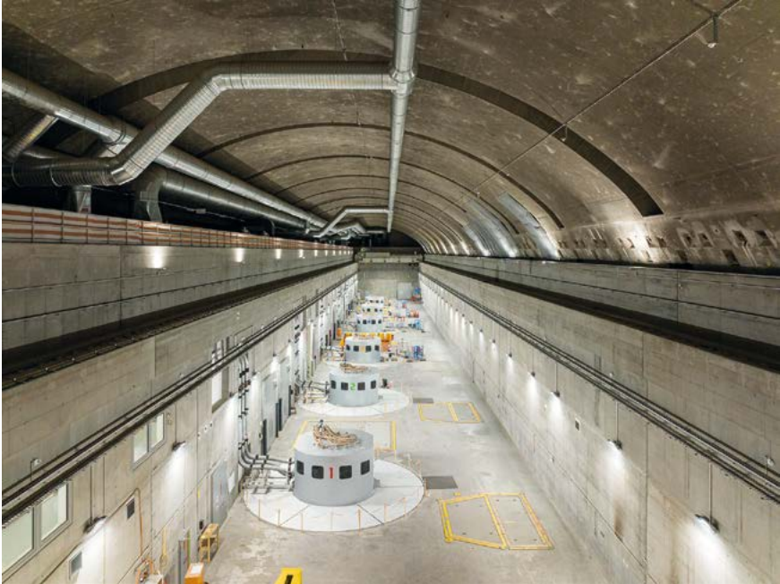
Das Pumpspeicherkraftwerk Nant de Drance

7. ... und Kapazitätsausgleich. – Insgesamt produziert die Schweiz 64 tWh elektrische Energie pro Jahr, und sie verbraucht etwa gleich viel. Angebot und Nachfrage von elektrischer Energie müssen aber immer ausgeglichen sein, weil sonst das Stromnetz gemäss dem Kirchhoffschen Gesetz zusammenbricht 20 . Deshalb muss die Schweiz laufend elektrische Energie importieren und exportieren. Ausser im Winter, wenn weniger Wasser zur Verfügung steht, hat die Schweiz einen Exportüberschuss. Die überschüssige Energie direkt zu speichern, ist bislang kaum möglich. Die Batteriespeicherung ist zwar sehr effizient, aber eine «unaffordable impracticality» (Mearns/Sornette): Wenn die Energiestrategie 2050 umgesetzt würde und man die im Winter fehlenden 6 tWh im Sommer mit Solar- und Wasserkraftanlagen produzieren und in Batterien spei-