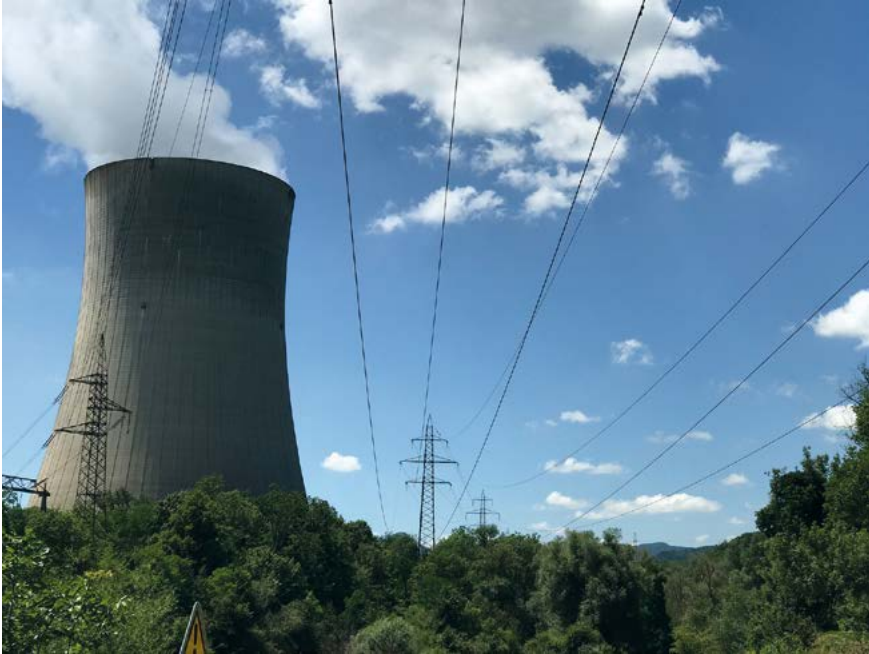
Höchstspannungsleitungen bei Gösgen

14. Die Verteilung: Netzebenen 3, 5 und 7. – Netzebene 3 wird mit Spannungen zwischen 36 kV und 150 kV betrieben (überregionale Verteilnetze, sogenannte Hochspannung). Auf dieser Ebene sind viele Wasserkraftwerke angeschlossen, wie z. B. die Flusskraftwerke am Rhein. Auch die grossen Endverbraucher, wie Papier- oder Stahlwerke, beziehen die elektrische Energie von der Netzebene 3. Netzebene 5 weist Spannungen zwischen 1 kV und 36 kV aus (regionale Verteilnetze, sogenannte Mittelspannung). Diese Netzebene dient der Verteilung der elektrischen Energie innerhalb von Städten und Dörfern; die grössten Photovoltaik-Anlagen sowie kleinere Wasserkraftwerke speisen hier ihre Energie ein, grössere Konsumenten wie Stahlverarbeiter, grössere Bäckereien oder Einkaufszentren beziehen sie hier. Netzebene 7 hat Spannungen unter 1 kV (lokale Verteilnetze, Niederspannung). Mit dieser Spannung wird die elektrische Energie im Quartier einer Stadt oder eines Dorfes verteilt, in ländlichen Gebieten wird damit auch eine grössere Umgebung versorgt. Von dieser Ebene gelangt also der Strom in die Steckdosen der Haushalte. Auch die Photovoltaik-Anlagen