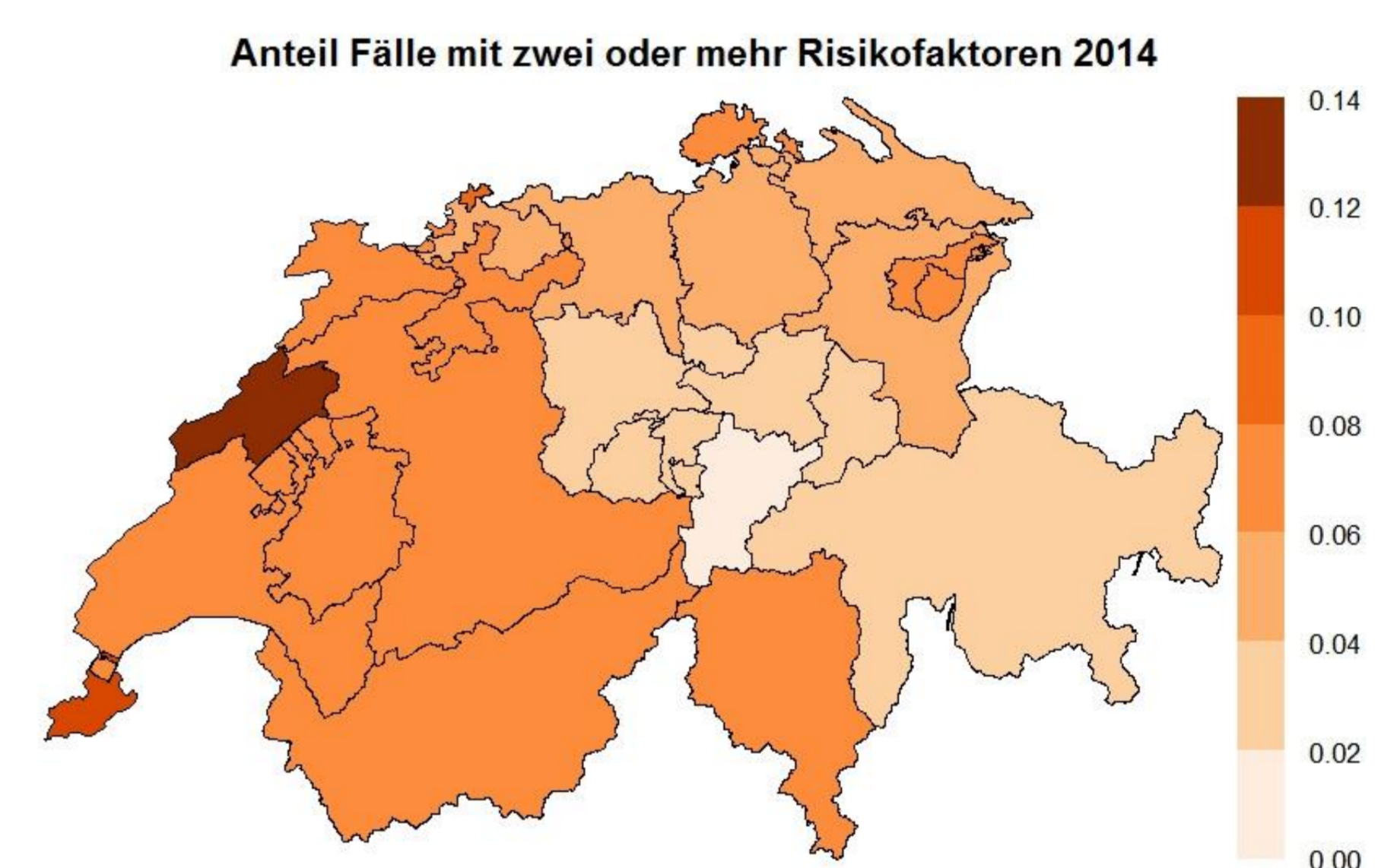
Abbildung 2: Geografische Verteilung des Anteils an Familien mit mindestens zwei Risikofaktoren in den Kantonen. Gesamtschweizerischer Durchschnitt: 6.3 %.