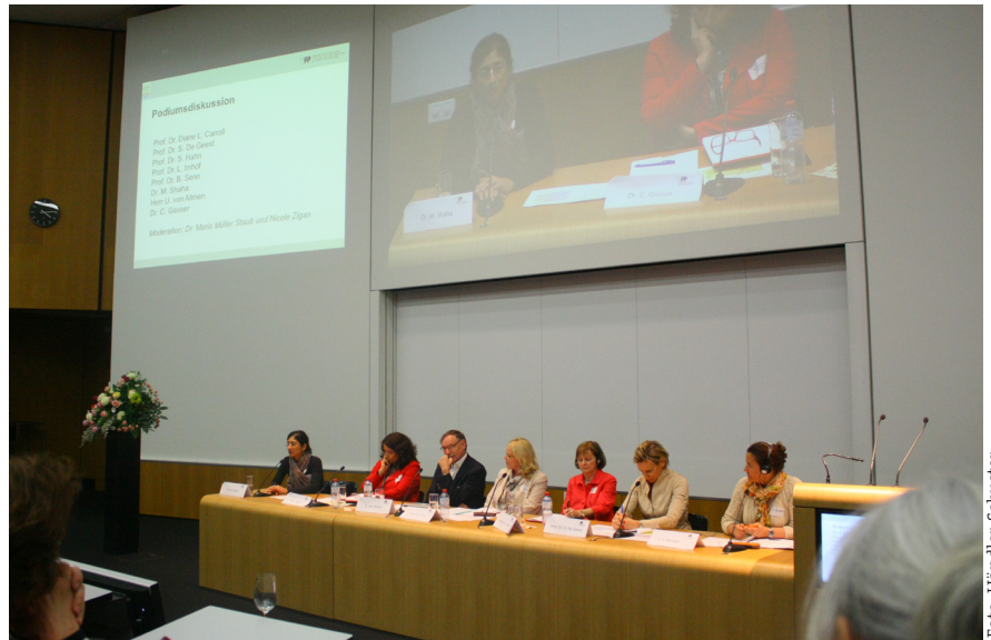
Fachtagung des VFP am 01.04.2014 zum Thema „Forschungsaktivitäten Schweiz – Pflege bewegt“.