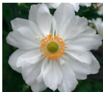
Anemone x hybrida 'Whirlwind'

'Whirlwind' ist eine amerikanische Züchtung von 1887. Heute zeichnet sie sich durch einen perfekten Wuchs und eine lang anhaltende, elegante Blüte aus. Sie ist die einzige doppelt gefüllt blühende weisse Sorte mit dem Prädikat «sehr gut». Sie erreicht Höhen von 90 bis 120 cm. Dank der gefüllten und reichen Blüte vor einer dunklen Kulisse ist sie eine strahlende Pflanze!