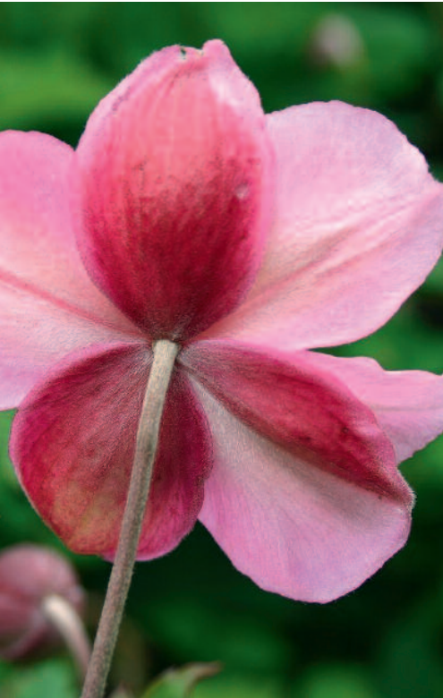
Anemone hupehensis 'Praecox'