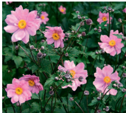
Anemone x hybrida 'Serenade'