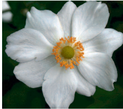
Anemone x hybrida 'Honorine Jobert'