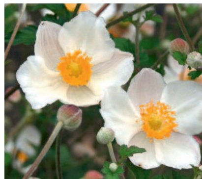
Anemone hupehensis fo. alba

violettrosa Blüten vor dunklem Hintergrund sollte sie mehr verwendet werden.