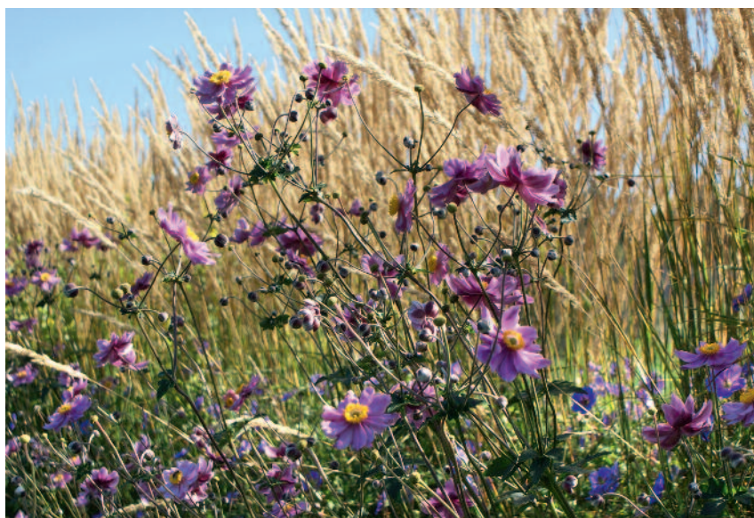
Herbst-Anemonen weichen dem Schatten aus. Kombinierte Pflanzung mit Geranium 'Rozanne', Calamagrostis und Anemone x hybrida 'Serenade'.

Bester Pflanzzeitpunkt ist das späte Frühjahr bis zum Spätsommer. Herbst-Anemonen müssen vor dem Winter gut einwachsen können. Bei späterer Pflanzung ist eine Mulchschicht als Winterschutz aus frischem Falllaub empfehlenswert.