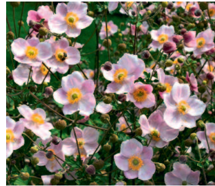
Anemone x hybrida 'Ouverture'