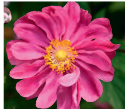
Anemone x hybrida 'Margarete'

oder weiss blühenden Herbst-Anemonen gut geeignet. Leider soll sie oft falsch im Handel sein.