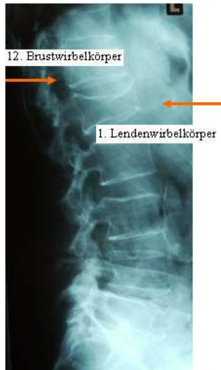
Abbildung 3: Seitliche Aufnahme des unteren Abschnittes der Wirbelsäule mit ausgeprägter Osteoporose und Sinterungsfrakturen des 12. Brust- und des 1. Lendenwirbelkörpers („Krankheitsbild: Wirbelkörper-Sinterungsfrakturen“ 2009)

che Beeinträchtigung der Funktionalität mit sich ziehen (DVO-Leitlinie, 2006). Die Einsinterung des Wirbels führt zu einer entsprechenden Knickbildung der Wirbelsäule nach vorne und damit zu einer Einschränkung der Rumpfstatik und Dynamik. Die Verlagerung des Rumpfschwerpunktes nach vorne führt zu einer Mehrbelastung anderer Wirbel, sodass es häufig im Verlauf zu weiteren Sinterungsfrakturen kommt („Krankheitsbild: Wirbelkörper-Sinterungsfrakturen“ 2009).