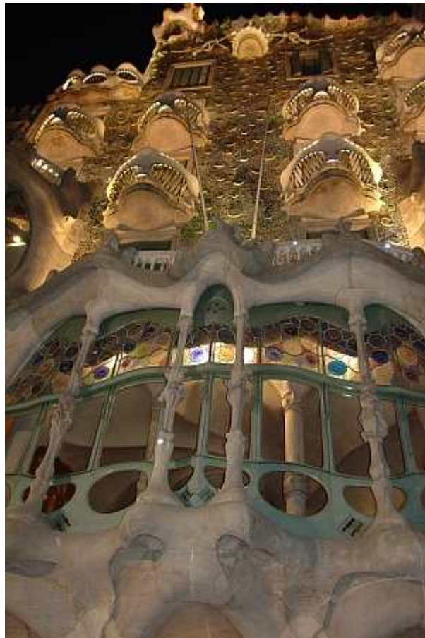
Abbildung 1: Casa Batlló, Barcelona (IOF, 2010)