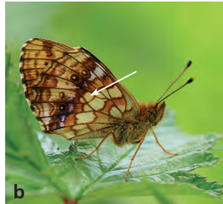
Abb. 1. (a) Brenthis daphne (Denis & Schiffermüller, 1775), Gemeinde Ottenbach (ZH), 6.7.2017 und zum Vergleich (b) Brenthis ino (Rottemburg, 1775).

Differenzialmerkmale: Hinterflügelrand bei B. daphne grossflächig violett übergossen, violette Zone bei B. ino schmaler und schärfer begrenzt; Mit Pfeil markierte Diskalzelle bei B. daphne konstant zweifarbig und distal dunkel gesprenkelt, bei B. ino hingegen bis auf einen schmalen dunklen distalen Rand gelb und nicht gesprenkelt (Baudraz & Baudraz 2016; www.eurobutterflies.com, abgerufen am 24.1.2018).