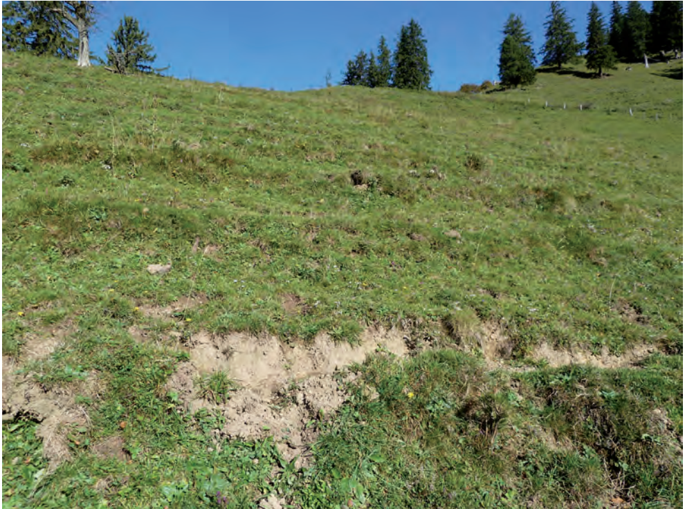
Abb. 2. Fundort von Phengaris (Maculinea) arion (Linnaeus, 1758) auf einer Extensivweide unterhalb des Schnebelhorns (Fiscenthal, ZH) auf 1150 m ü. M.

1150 m ü. M. nachweisen (Abb. 1). Das Individuum wurde auf einer extensiv genutzten, südostexponierten, relativ steilen Weide aus der Luft gekeschert. Die Weide zeichnet sich durch Viehweglein und offene Bodenstellen aus (Abb. 2) und war 2016 mit Rindern und Ziegen bestossen. Zahlreiche Pflanzenarten (z.B. Achillea millefolium , Carduus defloratus , Carlina acaulis , Euphrasia rostkoviana , Gentiana verna , Hieracium pilosella , Knautia arvensis , Ononis repens , Plantago media , Thymus pulegioides ) weisen gemäss Zeigerwerten von Landolt et al. (2010) auf eine starke Sonneneinstrahlung und/oder nährstoffarme Verhältnisse hin.