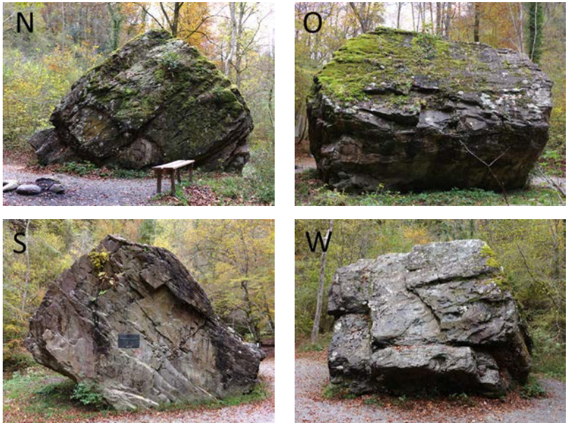
Abb. 1 Der Alexanderstein im Küssnachtertobel (Kt. Zürich) am 23.10.2015: Nord- (N), Ost- (O), Süd- (S) und Westseite (W). Der Findling hat eine Höhe von ca. 5 m.