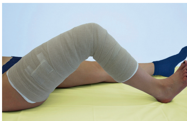
Abbildung 2. LKV bestehend aus Schlauchgaze, Polsterwatte und Kurzzugbinden. (Fotografiert durch die Studienleiterin 21.01.2015).

Die Patienten/Patientinnen der KG erhielten zusätzlich zu der oben beschriebenen Standardtherapie vom ersten bis zum fünften postoperativen Tag dreimal täglich für zehn Minuten eine Kältepackung (Physiopack® 13 × 30 cm, aufbewahrt bei -19°C), welche in ein Frottiertuch eingewickelt auf das Kniegelenk appliziert wurde. Für die Mobilisation wurde das Bein an den ersten beiden postoperativen Tagen mit einer Kurzzugbinde eingebunden. Ab dem dritten Tag trugen die Patienten Antithrombosestrümpfe (T.E.D.®).